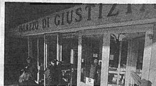
Il Tribunale di Grosseto

Anziani rapinati e truffati Sei condanne