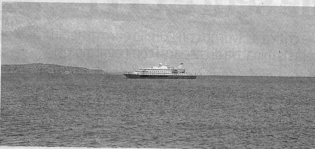
La nave da crociera Sea Dream II approdata ieri a Porto Santo Stefano

Navi da crociera all'Argentario: l'era del nuovo turismo